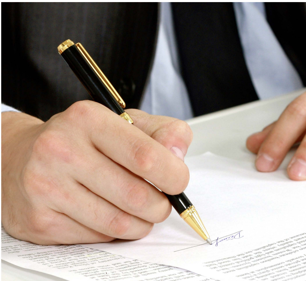
Verträge schaffen Klarheit beim Aussenhandel.